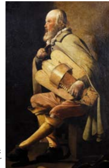
Georges de La Tour, Le Vieilleur à la sacoche, huile sur toile, 1 ère moitié du 17 e siècle.

Depuis le 19 e siècle, Charles Friry, puis ses descendants, prirent soin de conserver le caractère et le charme de cette demeure avec ses œuvres.