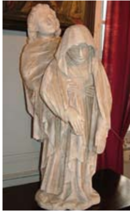
Pâmoison de la Vierge, calcaire de la Meuse, 15 e siècle.

La vie quotidienne du 19 e siècle y est également évoquée, notamment dans deux salles reconstituant une chambre à coucher et une cuisine traditionnelles vosgiennes.