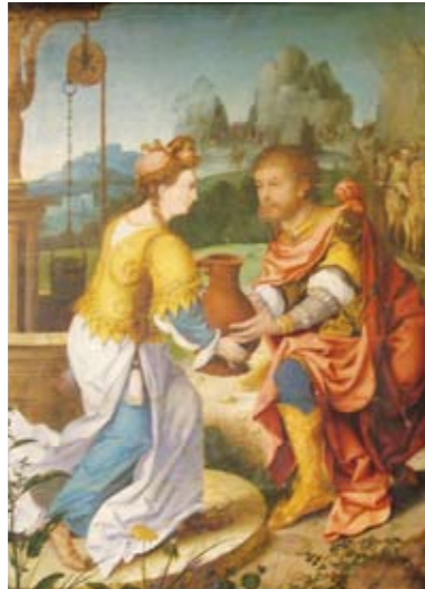
Joos van Clève (entourage), Eliézer et Rebecca au puits, huile sur bois, 16 e siècle