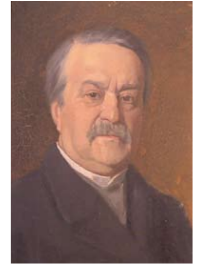
Charles de Bruyères, Autoportrait, huile sur toile, 19 e siècle

En 1905, Charles de Bruyères légua à sa ville natale son hôtel particulier du 18 e siècle et ses collections pour en faire un musée.