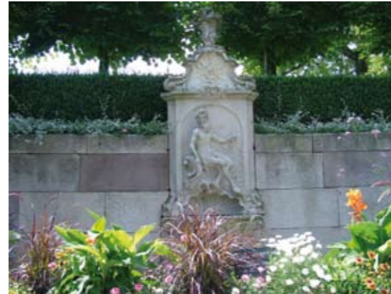
Fontaine de Neptune, 18 e siècle, parc du musée Friry.

La maison qui abrite le musée Charles Friry a été construite en 1750 dans le quartier canonial entourant l'église abbatiale. Elle était habitée par la Comtesse de Briey, dernière doyenne du chapitre de Remiremont, de 1759 à 1789.