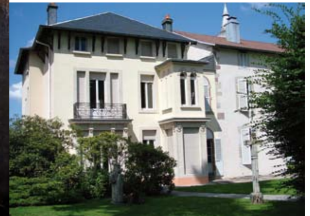
Façade arrière du musée donnant sur le parc.

Une salle nouvellement aménagée est consacrée à la donation du peintre romarimontain Jean Montémont (1913-1959) et présente son œuvre au travers d'un accrochage renouvelé régulièrement.