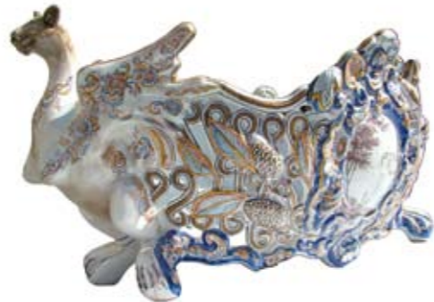
Coupe décorative, faïence signée Gallé, 2 e moitié du 19 e siècle.

L'un des courants les plus célèbres de l'art verrier fut lorrain : l'Ecole de Nancy. Créée en 1901 par Emile Gallé son plus illustre représentant, célèbre et apprécié des amateurs d'art du monde entier, sa production est bien représentée au musée, en particulier par des faïences.