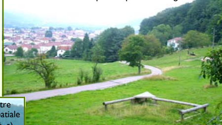
Remiremont, Centre ville et Eglise Abbatiale Saint-Pierre (XIII e s).